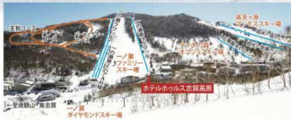
一ノ瀬ラビットキッズパーク